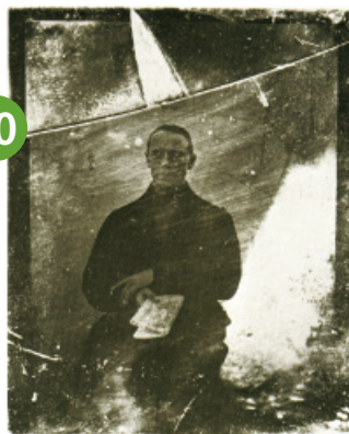
Janez Puhar, Avtoportret, hyalotipija (fotografija na steklu) ali svetlopiš, 12,1 x 10,3 cm, Janez Puhar, Self portrait, hyalotipy (Narodni muzej Slovenije Ljubljana)