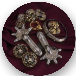
Zlat in srebrn nakit, odkrit leta 2004 v grobovih kranjskega Lajha. Golden and silver jewelry discovered in graves of Lajh in Kranj.

Mestna hiša je eden najpomembnejših kulturnih spomenikov renesančne arhitekture na Slovenskem. Na ogled je Renesանčna dvorana in tri stalne razstave: dela akademskega kiparja Lojzeta Dolinarja (1893–1970), arheološka razstava Železna nit in etnološka razstava Ljudska umetnost na Gorenjskem.