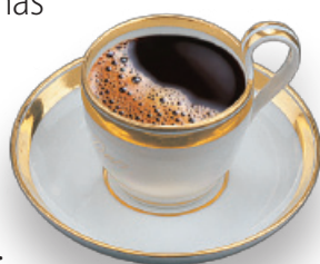
Porcelanasta skodelica iz zapuščine Barona Žige Zoisa iz leta 1832. Porcelain mug from the estate of Baron Ziga Zois 1832.

Visit Kranj to take a walk along Museum path and discover Gorenjska's noble past and its people. The path ends in the Khislstein castle, where after visiting interesting locations, enjoy a cup of coffee on our account. Welcome!